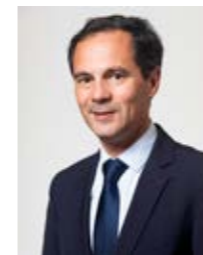
Guillaume BOUDY Maire de Suresnes