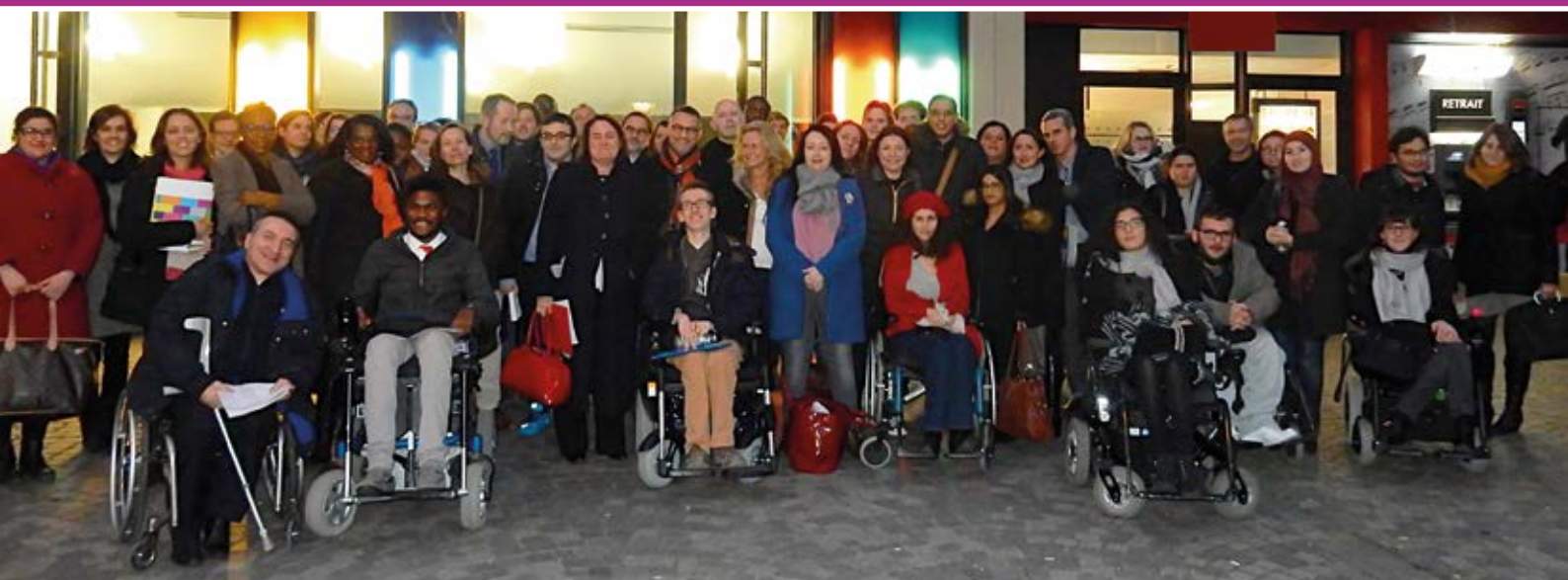
Objectif emploi, promotion 2017 : constitution des binômes étudiants/parrains à Suresnes.

Le dispositif suresnois qui accompagne les étudiants en situation de handicap vers l'emploi